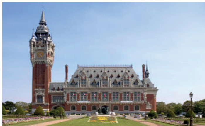
Beffroi de Calais

Tantôt aux commandes d'une régie publicitaire, dans le domaine commercial, du luxe, l'import export ou encore même l'édition (directrice d'édition et auteure) elle mènera à bien les projets confiés pour amener au niveau international certaines enseignes reconnues du métier. Un de ses atouts majeurs étant son leadership et sa facilité à fédérer au sein des équipes. Parallèlement, ses deux principales fiertés pros ?